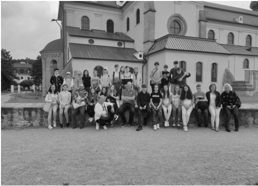
V4 program—Nová Lhota