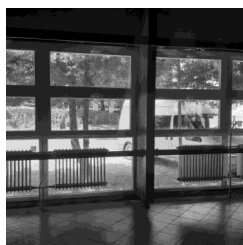
Nyílászáró-csere a Művelődési Házban

2022. év augusztus végére a Magyar Falu Programnál (MFP) elnyert pályázatnak köszönhetően 25 millió forint támogatásból kicseréltük az épületen az összes korhadt, rossz állapotban lévő külső nyílászárót. Ezen felül egy közösség-szervező pályázat révén sikerült új székeket, és asztalokat is beszerezni a rendezvényeink lebonyolítására. A pályázat a projekt idejére egy dolgozó bértámogatását is