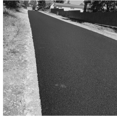
Park utca külterületi szakasz felújítása