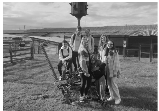
V4 program—Velky Kapušany