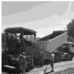
Park út felújítás

Ha visszatekintünk az elmúlt három évre elmondhatjuk minden évben sikerült egy-egy utcát felújítani. A 2019-es évben a Béke-Madách, 2020-as évben a Gesztenye-Rákóczi-Széchenyi utcákat. A tavalyi évben a külterületen fekvő mezőgazdasági út régóta indokolt felújítására került sor, amely a Park utca felső szakaszát jelentette, 620 méter hosszan. Az úttest közel 200 méteres szakasza 2 x 5 cm rétegű, 4 méter széles aszfaltozást kapott, felső szakaszára 3 méter szélességben, több rétegben zúzottköves kiépítés történt, és elkészült a terület vízelvezetése is. A beruházás 67 millió forintból valósult meg. Az útfelújítási sorozat az idei évben is folytatódik, sokak kérésére a TOP PLUSZ pályázatnak köszönhető 35,3 millió forintból nyárra elkészül az Árpád út felújítása, teljes 397 méter hosszan.