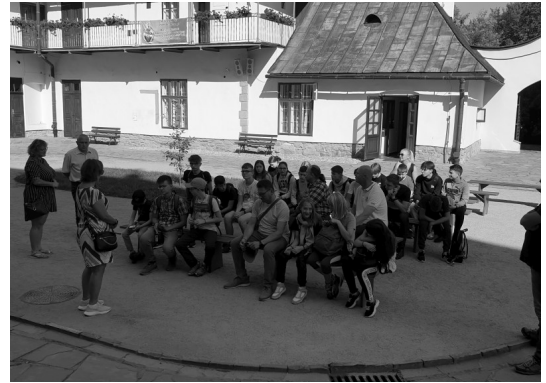
V4 program—Stary Sącz