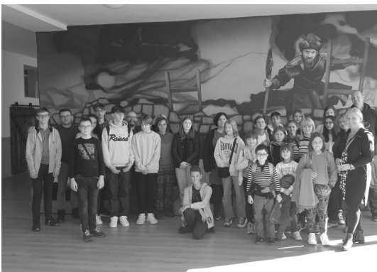
V4 program—Velky Kapušany