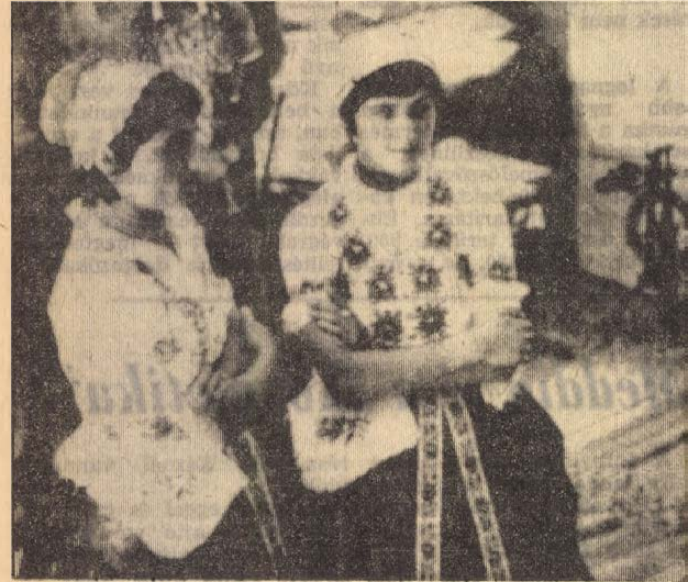
Népviseletbe öltöztek a fiatalok.

A népművészeti színpadi bemutató számára viszont annál kellemesebb volt a környezet. Az iskola parkjának