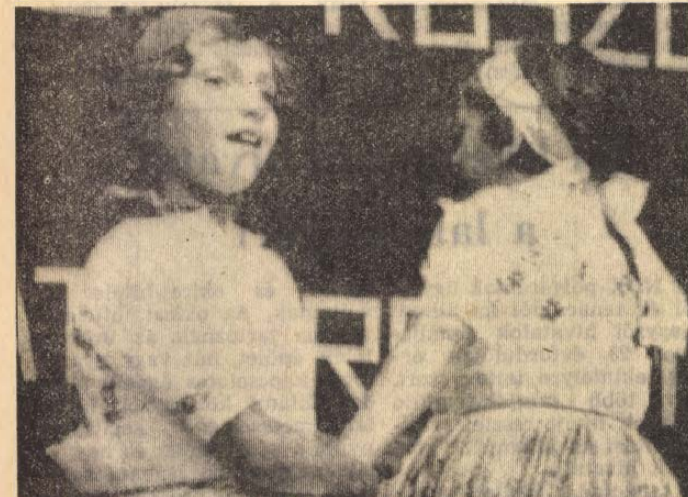
Gyermekprodukciók színesítették a népművészeti bemutatót.

A község sajtóosságából fakad, hogy a kulturális rendezvényeket főként az általános iskolában, hivatalok tanácskozótermében és a szabadtéren tartják. Nézsán