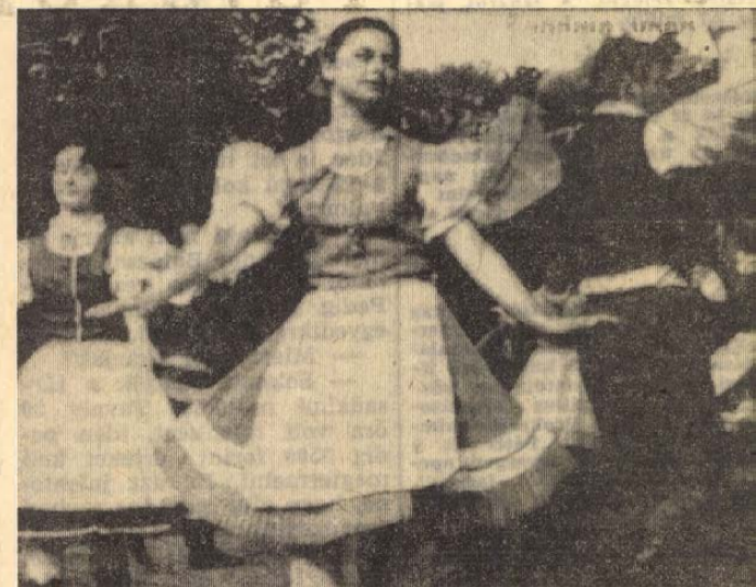
Nagy közönségsikert aratott a rétsági Börzsöny táncgyüttes.