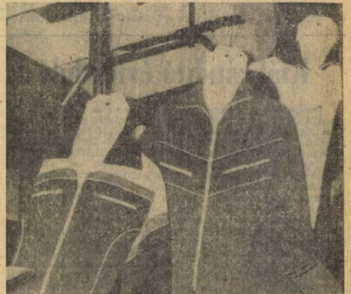
Akár utcán is hordhatók a Váci Kötöttárugyár melegítői.

A múlt hét péntekjén megnyílt őszi Budapesti Nemzetközi Vásáron, a fogyasztási cikkek reprezentatív nemzetközi bemutatóján megyénk gyárai is részt vesznek termékeikkel. Különösképp jeleskedett a ZIM salgótarjáni gyára, amely a 750-es típusú termécsaládjával a vásár nagydíját nyerte el, de díjazott lett a Salgótarjáni Ruhagyár, a Váci Kötöttárugyár és a Romhányi Építési Kerámiagyár készítménye is. Tegnapig már több tízezer látogató, hazai és külföldi győződhetett meg a megyei gyárak jó munkájának eredményességéről. Képeink rövid ismétlőt adnak a BNV-n látottakból.