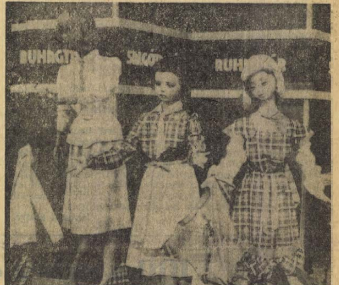
A Salgótarjáni Ruhagyár vásári díjas termékei sok látogatót készítettek megállásra.