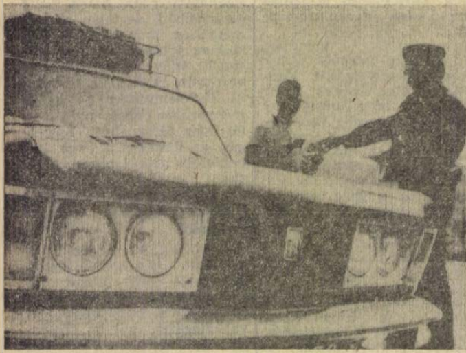
Köszönjük, rendben! — szól az útlevelekezelő, s máris nyílik a sorompó.