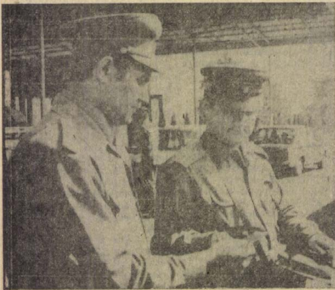
A magyar és csehszlovák határőrök közösen végzik feladataikat.

Jóval csendesebbek az országhatárok ezekben a hetekben, mint a nagy nyári népvándorlás, a turistainvázó ideje. Am az itt szolgálatot teljesítőknél manapság is akad bőven munkájuk. Parassapusztán, Magyarország egyik legjelentősebb „kapujában” pontosan végzik feladatukat a határőrök és vámőrök. Sokan szolgálati ügyben kéri átkelésüket, mások családi okok miatt utaznak hozzánk vagy tőlünk külföldre. A hétvégeken ismét a kirándulókat hozza lázba „szomszédolásra”. Képeinken erről a nógrádi határ-átkelőhelyről mutatunk be néhány pillanatot.