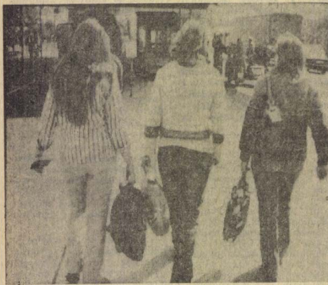
A diáklányok szabad szombatjukat töltik külföldön. Útra-valójuk elfér egy kizárólagos kocsiban.