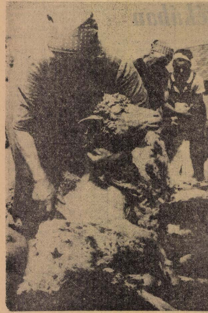
Mesterien kezelik az asszonyok a nyíróollót, nemhiába régi szakmabeliek