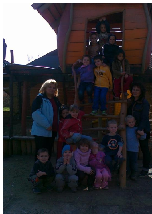
Nézsai ovisok a Seholsziget élményparkban